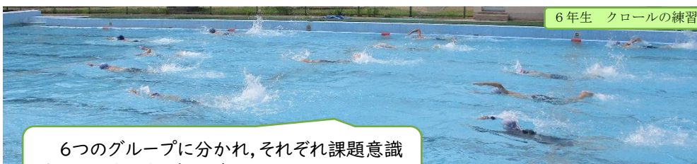
6年生 クロールの練習