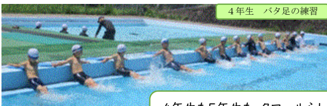
4年生 バタ足の練習

大切なのは、 宿題+自主学習という学習習慣 を身に付けることです。非認知能力の『自分をコントロールする力』・『主体性』・『挑戦力』が必要です。頑張ろうとする気持ちを少しでも応援したいと思い、ほぼ毎日自主学習を見えています。そして、取組が素晴らしいノートにはシールを貼っています。上学年は、見開き2ページにしっかり取り組んでいるかを見えています。自主学習の内容は大きく三つです。一つ目は予習。二つ目は復習。苦手なところの見直し、テスト対策、テスト直しなどの学習内容です。三つ目は、興味関心のあることです。歴史や科学(宇宙、自然、人体、動植物の観察と生態、恐竜等)、歴史、古典、詩や俳句・和歌、英語などです。恐竜について8ページも調べた児童や英語の学習をどんどん進めている児童もいます。振り返りで、「自分が分からなかったことが分かるようになって自信が付いた。」「今度のもっと〇〇について勉強したい。」「今まで知らなかったことに気が付いてよかった。」などと書かれています。日々の積み重ねを大切に力を付けていってほしいと思います。