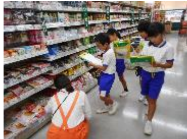
【3年 お店の工夫を取材中！】