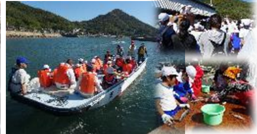
【4・5年生 大島・美の浜漁協で漁業体験】