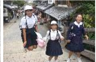
【映画村で遊んだよ！】