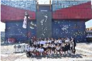
【海遊館をバックに！】

この2日間の体験は、小学校生活の大切な思い出として6年生のみんなの心に残ることと思います。残り半年をきった小学校生活も充実したものにするために、これからも、みんなで協力して学校生活を送ってみたいと願っています。