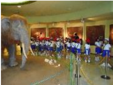
【1・2年 自然史博物館にて】

10月には、2日（水）に1・2年生のバス旅行、3日（木）3年生の社会科見学、9日（水）には、4・5年生による「大島海辺の教室」への参加など、どの学年も校外での体験学習を行いました。子どもたちの感想を聞いたり、見学でお世話になった方に書いた手紙を読ませてもらったりする中で、実際の体験を通して日頃教室で学習していることが深まったり広がったりしているのを感じることができました。今後も、自分の目で見て、耳で聞き、心で感じることでできる体験学習を大切にしていきたいと思います。