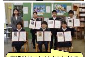
清明賞をいただくことができて、うれしかったです！