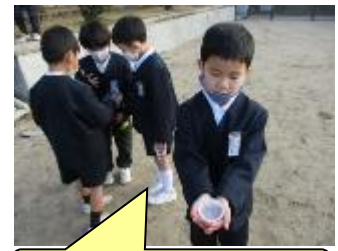
見て見て！氷ができたよ！

始業式後の3連休明けには、1年生が、生活科「ふゆをたのしもう」の学習で、氷作りに挑戦していました。お気に入りのカップに水を入れて置きたい場所に一晚置き、次の朝確かめるという活動です。大きな氷ができた子もいれば、残念ながらできなかった子もいます。できなかった子は、水の入れ方や置き場所を変えて再チャレンジです。目的を達成するために試行錯誤しながら、たくさんの発見をしてほしいと思います。