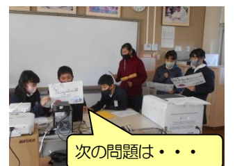
次の問題は・・・

今年度は、感染症対策のために、いろいろな集会をオンラインで行っていますが、子どもたちの対応力はすばらしく、回を重ねるごとにスムーズにできるようになってきています。今後の活動も楽しみです。