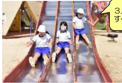
3人いっしょにすべったよ！