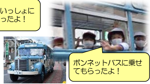
ボンネットバスに乗せてもらったよ！