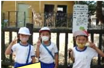
キリンとっしょに、はいチーズ！

バスに乗って校外に出かけ、貴重な体験をしてきた子どもたちは満足そうな顔で帰ってきました。