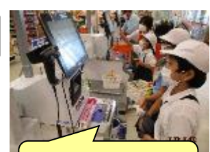
セルフレジで、お金を払ったよ。