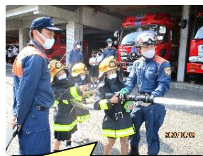
すごい勢いで水が出るよ。